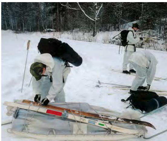
Pulka med gemensam utrustning.

Syftet med utbildningen är att förbereda eleverna för verksamhet under vinterförhållanden. Att slarva och göra misstag kan straffa sig rejält i vintermiljö så en bra förberedande utbildning ökar förståelsen och förmågan att göra rätta åtgärder när så behövs.