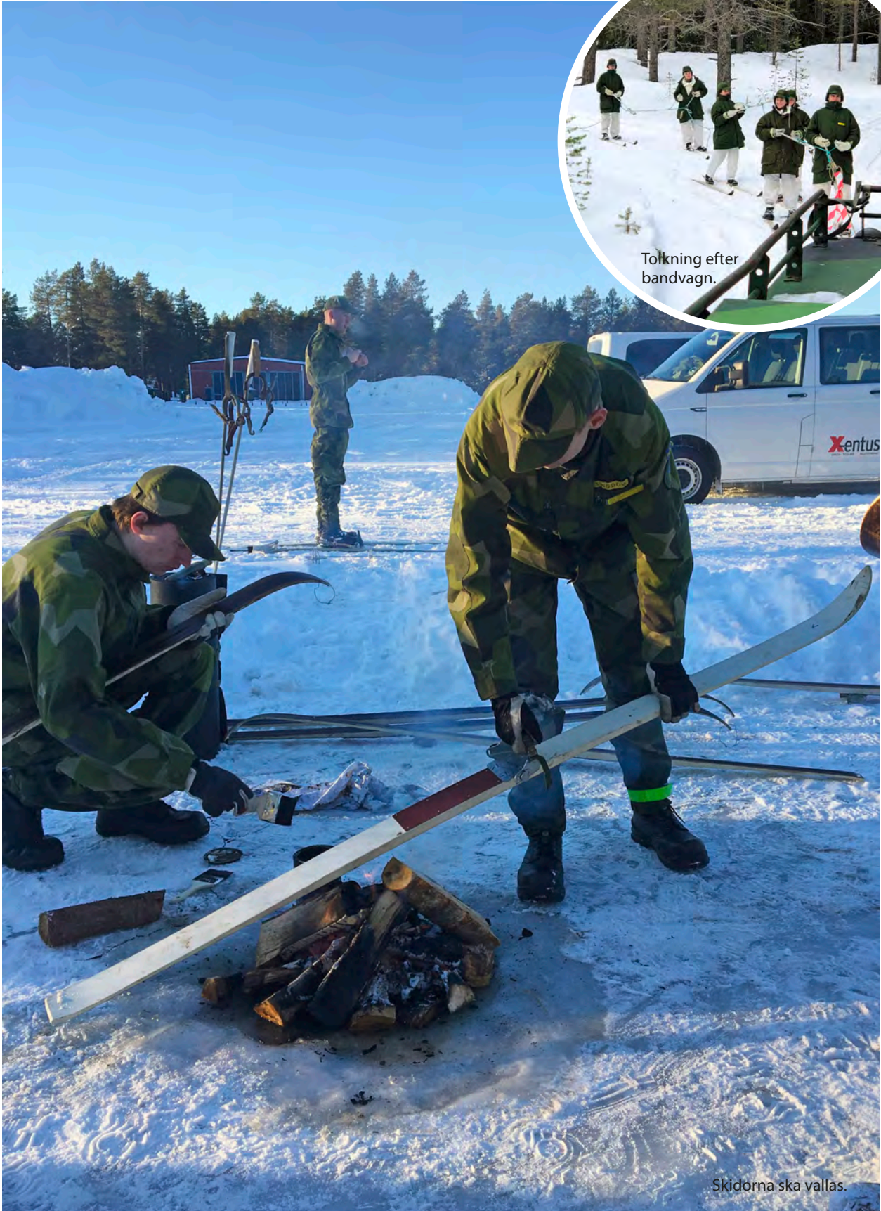
Tolkning efter bandvagn.