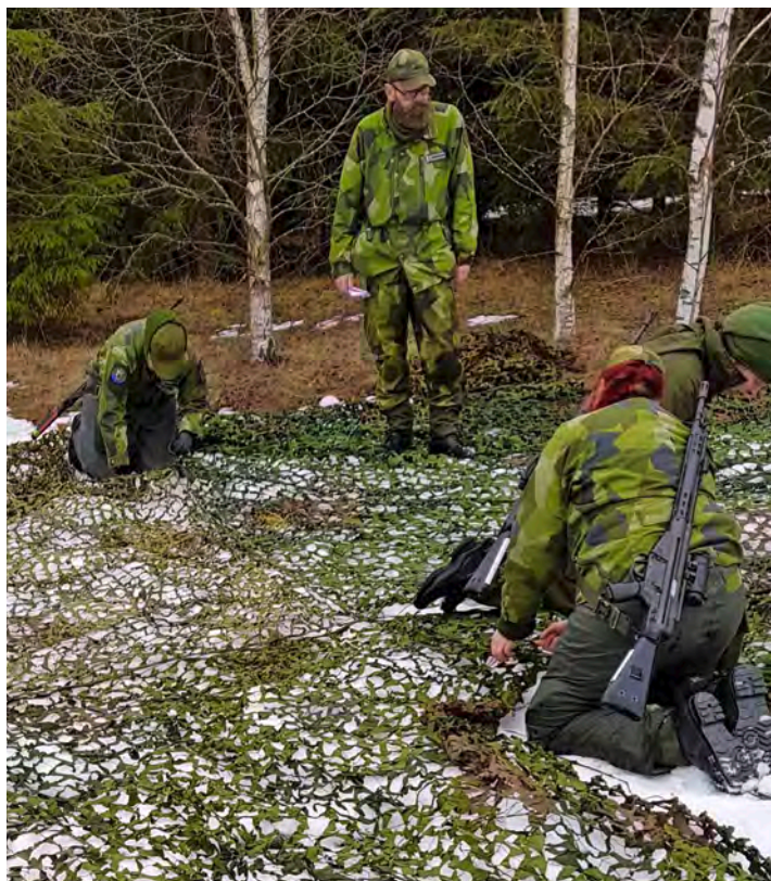
Övning i maskering.

Utvärdering är en central del i formativ bedömning som vi arbetar utifrån. I stora drag innebär det att både eleverna och instruktörerna efter varje TU-