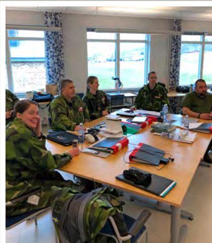
Lärargenomgång efter övning.