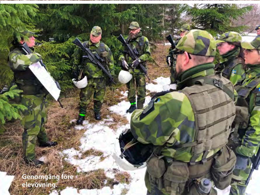
Genomgång före elevövning.