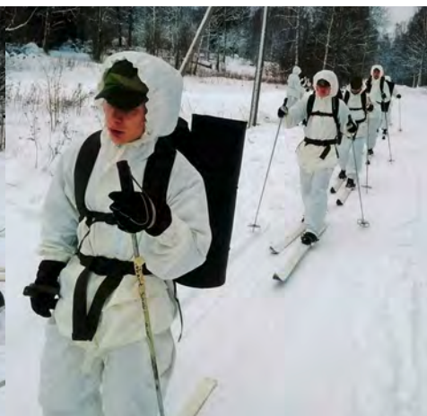
Utbildning i skidmarsch.

Utbildningen började på fredagen med att prova till skidorna som i militära sammanhang kallas för ”Vita blixten”. Efter lördagsmorgonens inre tjänst var det dags att tjära skidorna, vilket var en nyhet för en del av de yngre eleverna. När tjärningen var klar påbörjades skidmarschen ut mot förläggningsplatsen. Under marschen slår olyckan till, en instruktör med funktionär har kört av vägen och in i en elstolpe. Föraren sitter kvar i bilen medan passageraren har slängts ut genom framrutan. Eleverna kommer fram till olycksplatsen och påbörjar omhändertagandet av de skadade och upptäcker straxt att det börjar ryka. Bilen brinner, föraren måste ut och bort ifrån det farliga området och läggs på värmejackor. ”Momentet avbryts” kommer ifrån momentövningsledaren. Olyckan var arrangerad, ett övningsmoment och ingen var skadad. Efter feedback från skademarkörer och momentövningsledaren genomfördes övningen en gång till, med mycket gott resultat. Både elever och instruktörer känner sig nöjda över prestationen, jag tror nog att momentövningsledaren känner sig lite extra stolt över hur väl eleverna genomförde båda momenten och hur väl de tog till sig feedbacken från första momentet. Därefter var det dags att fortsätta skidmarschen.