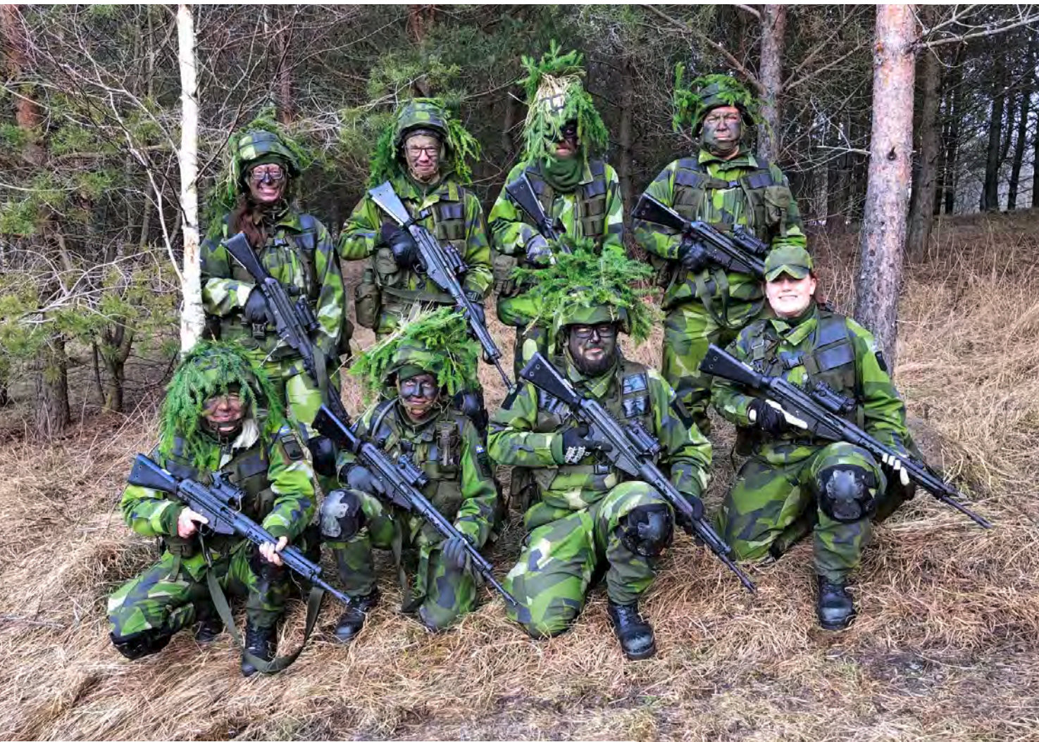
IK G gruppfoto.