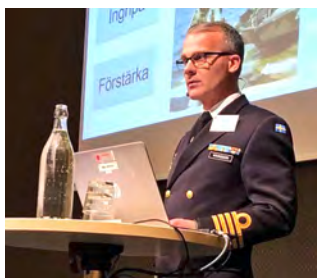
Jon Wikingsson, kommandör, Försvarsmakten.

- Hur kan vi kommunicera bättre? frågade Jon retoriskt och uppmärksammade att olika definitioner av begrepp som ”samverkan”, ”samordning” och ”strategi” försvårar samverkan mellan Försvarsmakten och civila myndigheter.