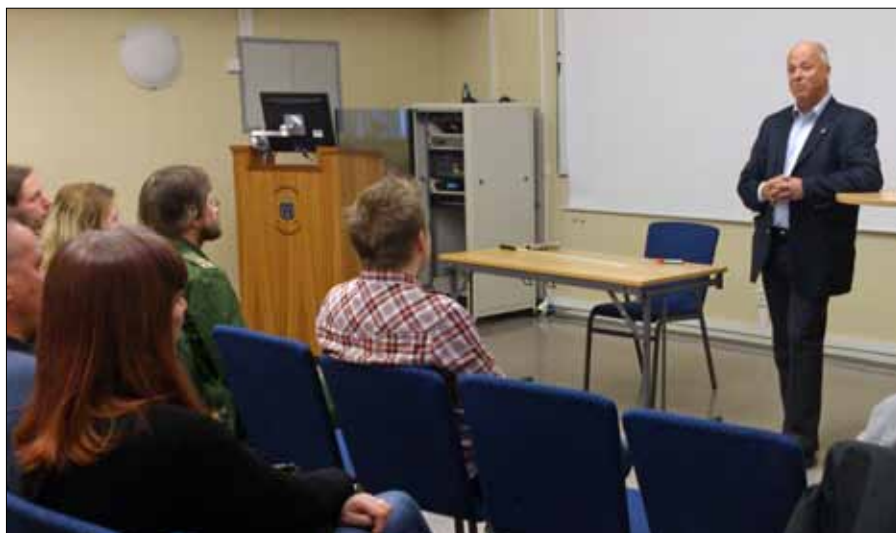
Generalsekreteraren informerar mötesdeltagarna