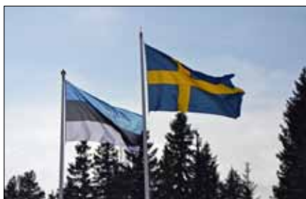
Våra två flaggor vajande på Skyttecentrum.

Kursen gav ungdomarna framför allt kunskaper om utbildning i vintermil-