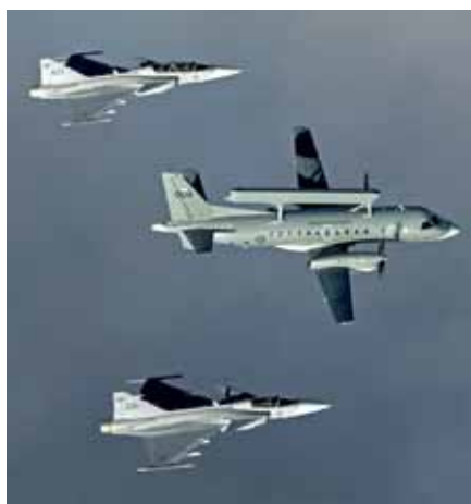
Strilbat ASC 890 eskorterad av 2 st JAS 39

Flygvapnet har två stycken flygburna stridslednings och luftbevakningsflygplan. Dessa kallas ASC 890 (Airborne Surveillance and Control). De kan mycket snabbt förstärka eller ersätta radartäckning och led-