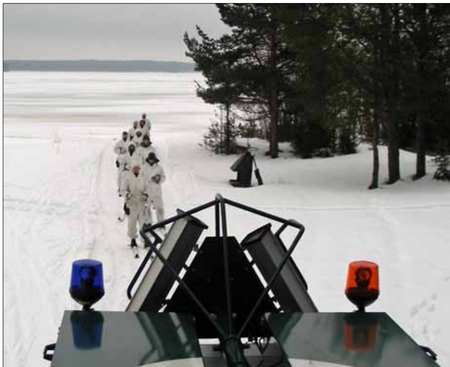
Skidtolkning efter bandvagn - spännande och svårt

Förväntansfulla ungdomar satte på skidorna och kopplade stavarna efter tolklinan. Nu var det äntligen dags. Försiktigt startade bandvagnen och alla stod fortfarande kvar på skidorna. Första svängarna gick utan problem. Farten kunde ökas på lite. Efter en liten stunds tolkning med mycket glädje och några fall så blev det en liten stunds skidning för att få upp värmen. En tur till efter band-