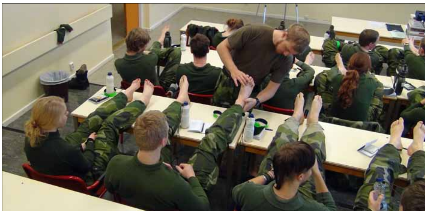
Skidor skall vallas, fötter skall smörjas och elever skall tränas

Fredagen bestod av rivning av förläggning samt skidmarsch tillbaka till Norra Kasern. När eleverna var tillbaka delades de in i två grupper där den ena genomförde tolkning efter bandvagn och den andra ge-