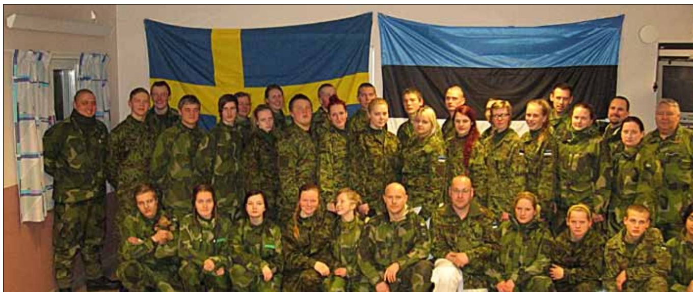
Ungdomar på vinterutbildning i Östersund