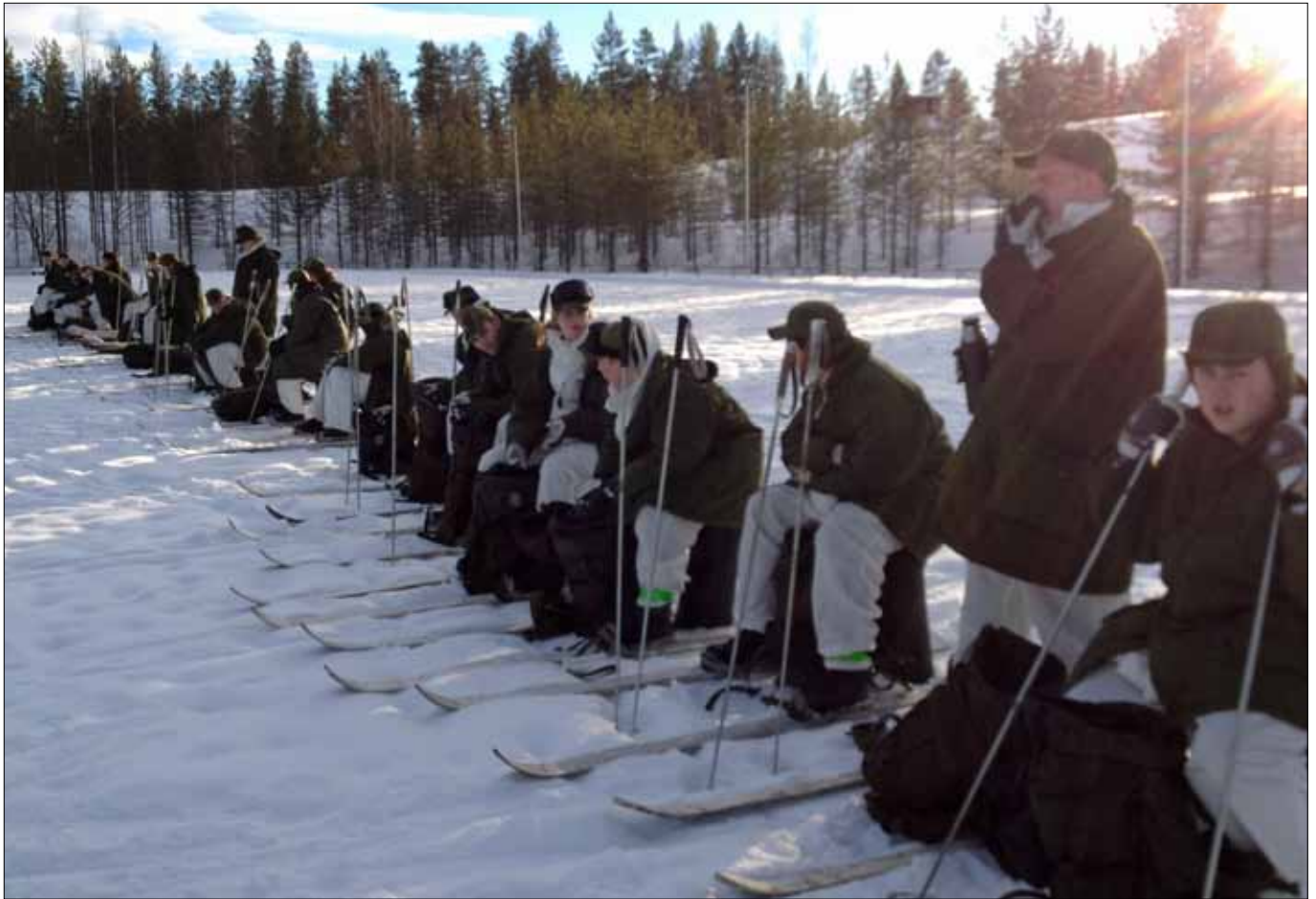
Eleverna gör en sista uppladdning inför skidturen

nomförde studiebesök på Trängslets kraftdamm med skifte i halv tid. Vid lunch samlades alla för att ta kursbild samt att sjunga nationalsången för den nyfödda prinsessan. Eftermiddagen och kvällen bestod av inlämning av uthämtad vinterutrustning och vård av Norra Kasern.