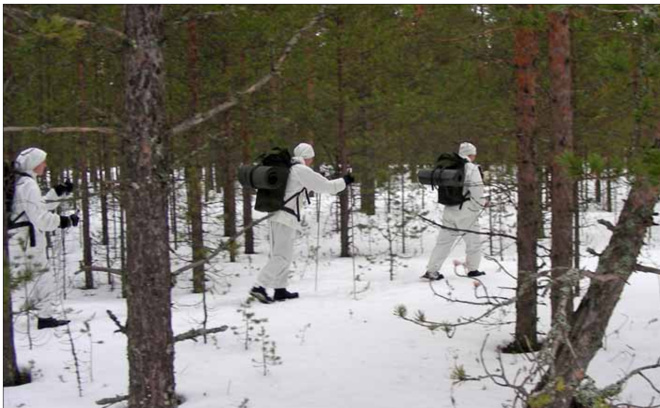
På skidor - någonstans i Sverige

Gruppen delades på två täter där den ena täten inledde med luftgevärsskytte samtidigt som den andra täten fick lära sig att tejpa fötterna. Efter en välbehövlig sömn så inleddes