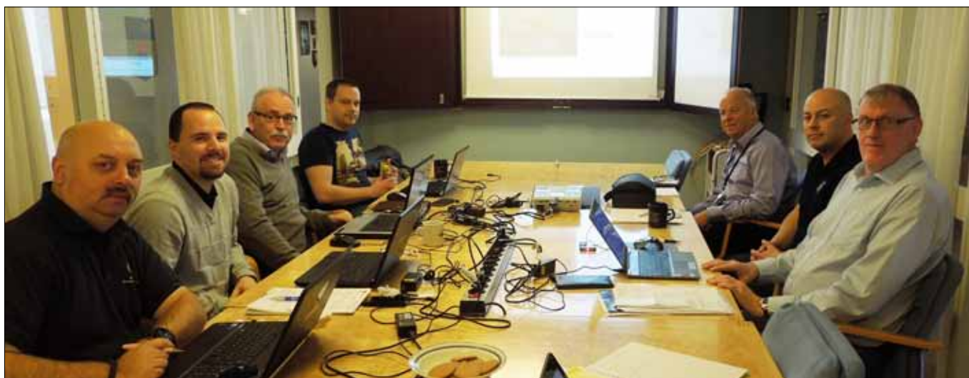
Flygvapenfrivilligas regionala kanslichefer på utbildning i Stockholm där bla vårt nya medlemsregister behandlades