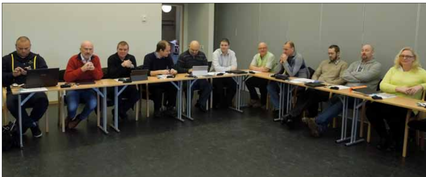
Här, en del av årets kurschefer, som med stort allvar tar sig an utbildningschefens information