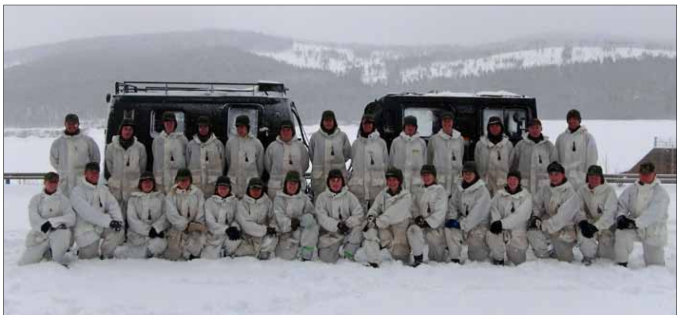
Glada miner i en välmotiverad vinterkurs i en prydlig formation