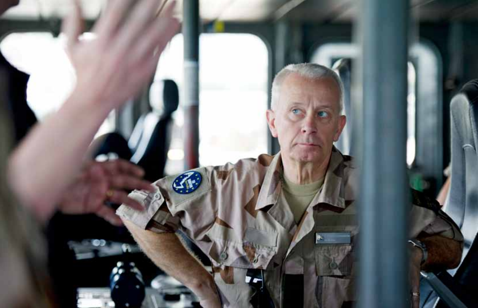
ÖB förordar en utveckling av Försvarsmakten där kvalitet sätts i centrum.

närområdet kan jag som ÖB inte rekommendera en mindre förbandsvolym. Jag vill fortsätta utveckla IO 14! Men om det inte tillförs högre anslag leder detta till ett vägval mellan degraderad förmåga eller bibehållen kvalitet men då med mindre volym än IO 14.