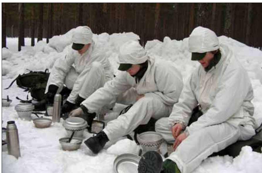
Här smakar det gott med egen tillagad middag

Efter städning och visitation på tisdag morgon så var det dags för en utbildning i kallt väder som hölls av officerare från F 21. Efter förmiddagens teoripass så sattes kunskaperna på prov. Efter en stunds justerande av klädsel så bar det iväg på en fotmarsch ut i skogen. Lunchen bestod