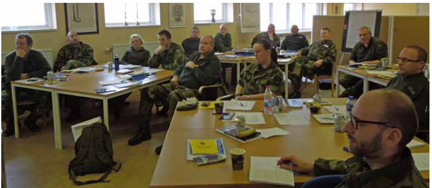
Eleverna följer spant kursledningens alla tips och råd på vägen till att bli Adjutant