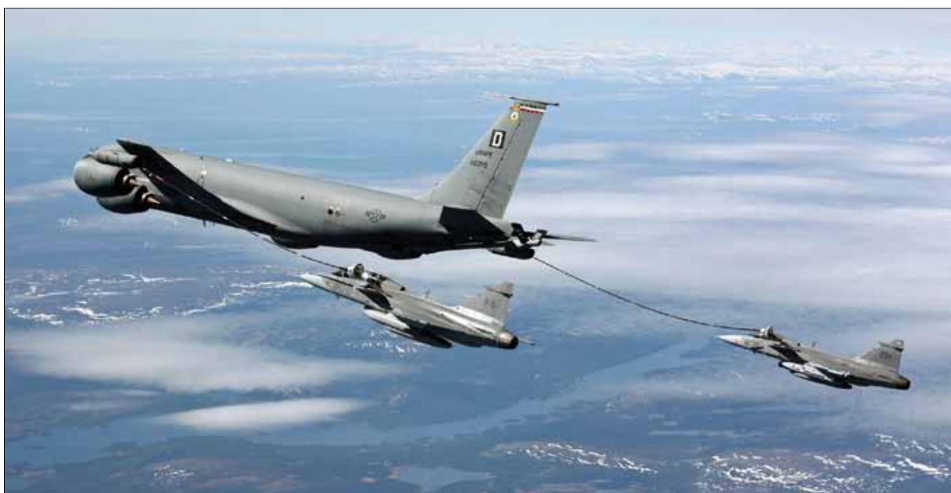
Bilden visar hur bränsle överförs från tankern till mottagande flygplan under flygning. JAS 39 Gripen är kvalificerad att under flygning tanka från flera olika tankers, vilket är en stor fördel och nödvändighet för att kunna delta i såväl internationella övningar som skarpa insatser.

Det är inte bara i Gripen E-projektet som denna nya tanke fått fäste. Även inom det befintliga JAS 39 Gripen C/D jobbar man också på att samordna sin provning för att snabbare och billigare kunna få ut flygplanen i operativ drift i senaste version. Inom helikopterprovningen görs motsvarande satsning, där man exempelvis för HKP14 har ett nära samarbete med Försvarsmakten t ex genom gemensam besättning i provverksamheten och gemensamma provprogram. Allt i syfte att tidigt tillva-