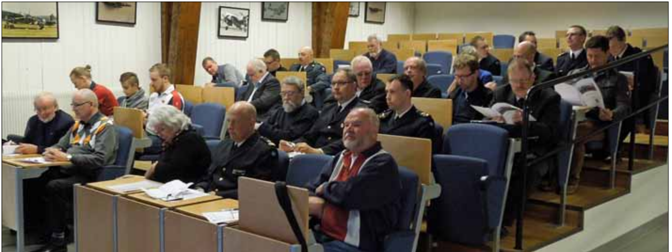
Deltagarna i årsmötet granskar verksamhetsberättelsen