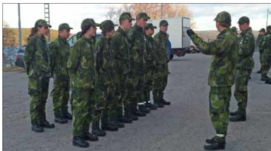
Elever ur FVR M klara för exercis

Grundkursen genomförde lektioner i värdegrund, sjukvård och pratade om kylskador och skador relaterade till kallt väder/vintermiljö, eleverna hade också nöjet att bli truppförda av ledarskapskursen under ett exercispass. Fortsättningskursen genom-