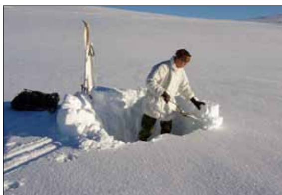
Alla byggen börjar med en bra grund

Även våra Vinterkurser får till del en ny grundförutsättning. Vi tänker tillsammans med FV Frivilligavdelning skapa en fast skolorganisation i Älvdalen som har ”kontroll” över merparten av de resurser som krävs och där sedan de olika regionerna kan ansluta och ”jacka in” sin kurs. En modell som