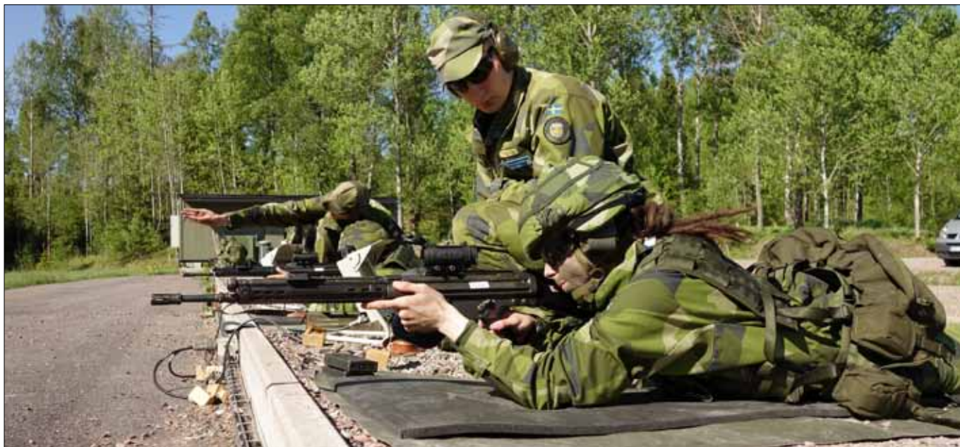
Vapenutbildning under Military Weekend - Foto: Försvartsutbildarna, Jörgen Fagerström