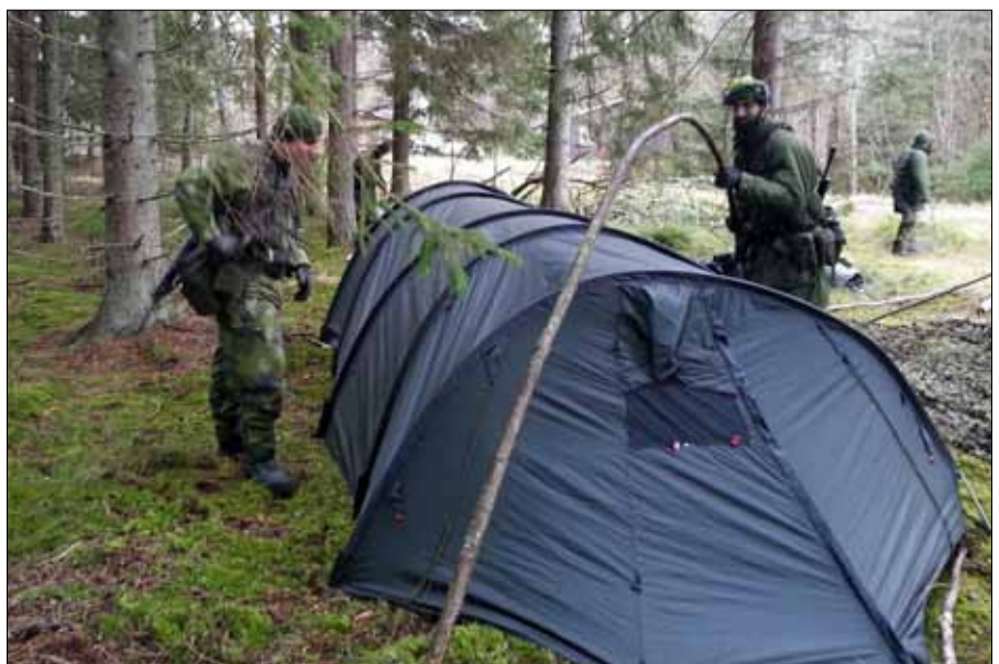
Elever ur HvUndkurs i Såtenäs under uppförande av patrulltält 6