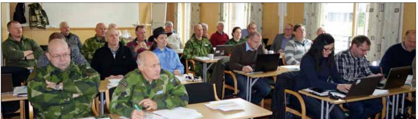
Deltagare från Försvarsmakten och frivilliga försvarsorganisationer