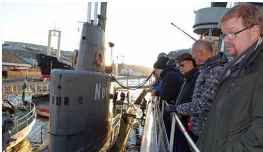
Ubåten Nordkaparen väckte stort intresse