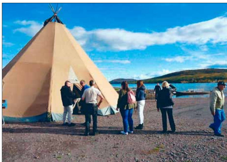
Norrländskt fältkaffe vid älvens strand

Där fick vi info om hur Ishotellverksamheten fungerar samtidigt som vi bjöds på kokt kaffe över öppen eld i en av tältkåtorna som ställs upp vid Torneå älvens strand.