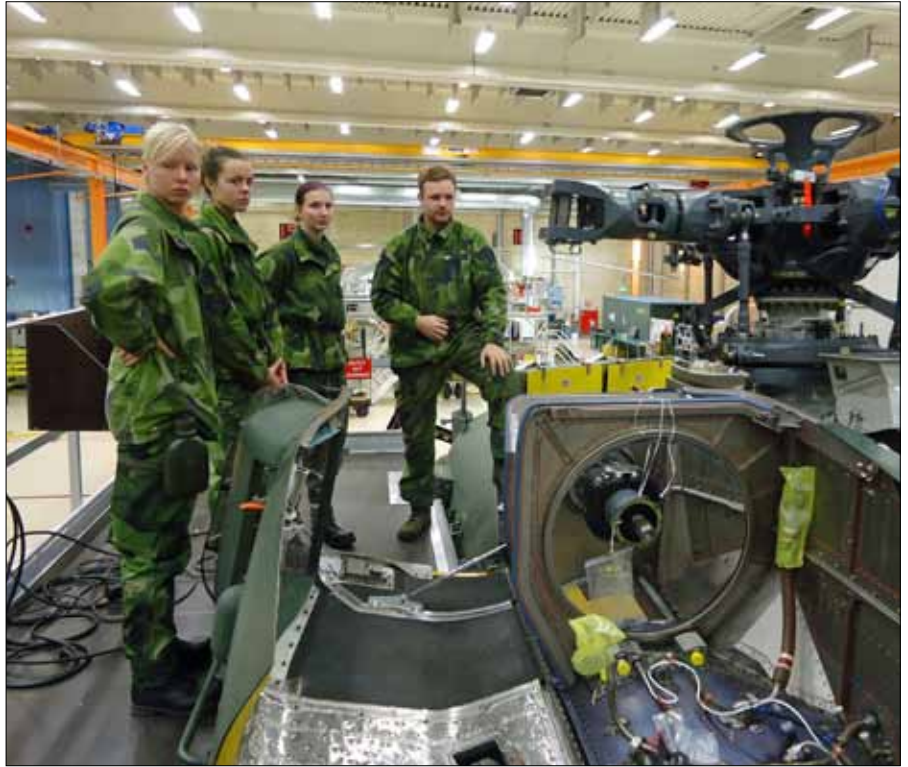
Intressant förevisning av FM tekniska materiel

Efter en uppskattad och välförtjänt lunch i skogen återstod marschen