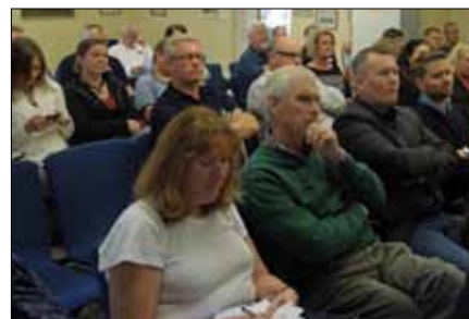
Deltagarna informeras av AG/Instruktör