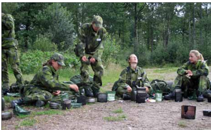
Egen tillagad mat smakar alltid bäst