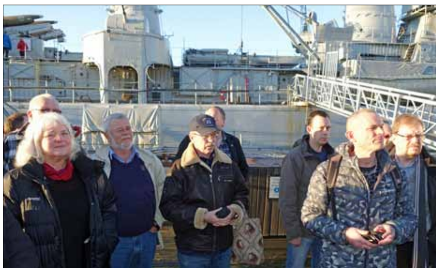
Intressant föreläsning om Jagaren Småland