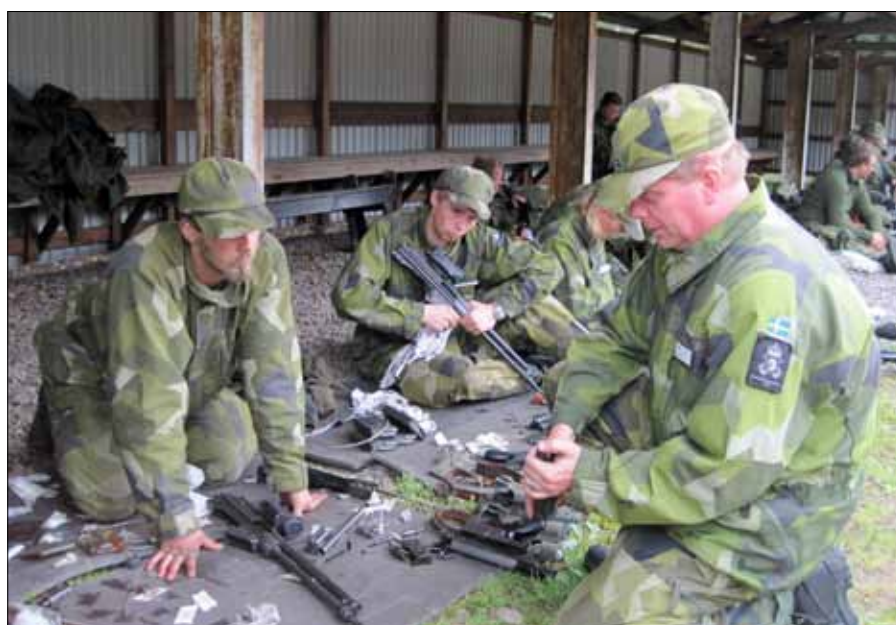
Instruktörstjänst på en GU-F