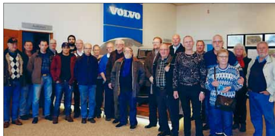
Deltagarna ur Region Syd samlade på Volvo museum

fortsatte färden till Maritiman med guidning på Jagaren Småland och Ubåten Nordkaparen. Besöken, med en mycket bra guidning, var både uppskattade och mycket intressanta.