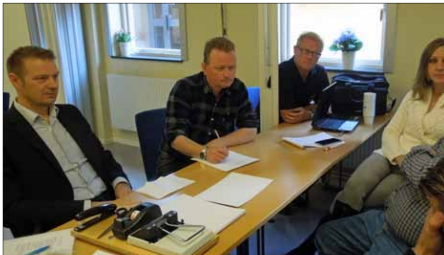
Djupt försjunkna i grupparbete

sina arbeten som sedan kommer att besvaras och redovisas på Itslearning.