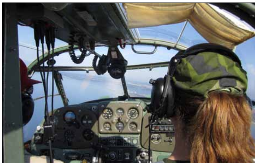
Sommarkurs med ett flygpass

tering. Flygvapenfrivilligas Riksförbundsstyrelse (RFS) har ansatt en tydlig inriktning att FVRF – samtliga funktioner – måste utveckla sin förståelse för och förmåga att genomföra rekrytering . Ramarna för detta kommer RFS att ange dels i en PM att gälla över tiden och dels i sina Riktlinjer för 2015.