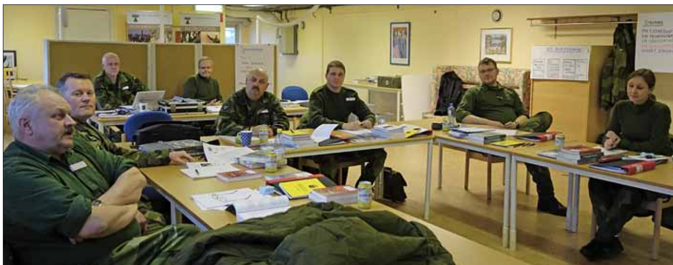
Blivande Handledare på kurs IK HL i Halmstad