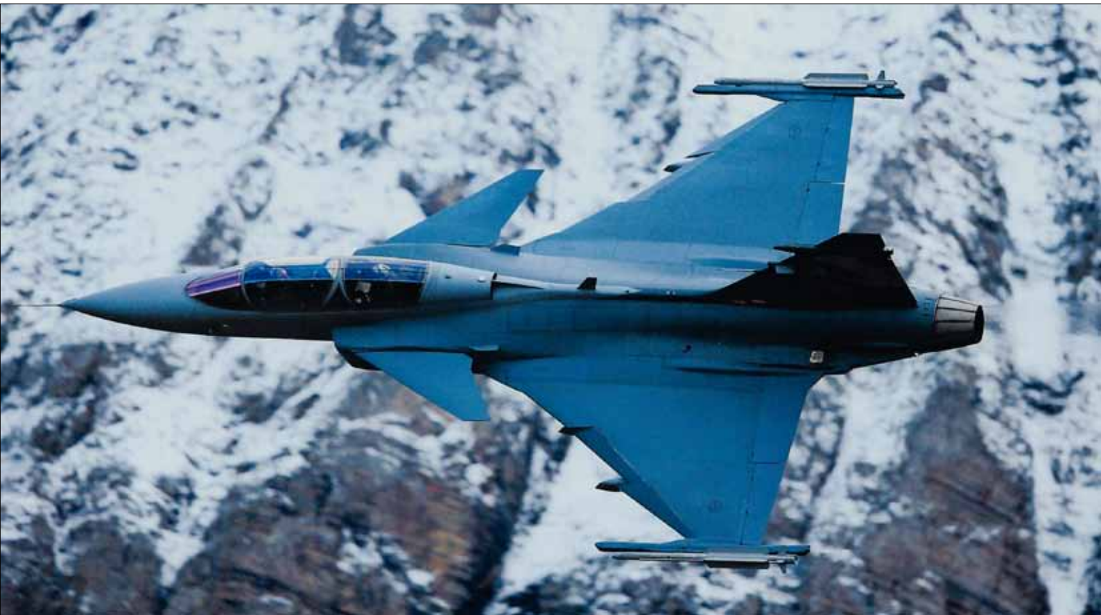
Demoversion av JAS Gripen NG (Next Generation) används av FMV och Saab för tester i utvecklingsarbetet av 39E.

Inom ramen för utvecklingen av JAS 39 Gripen E har FMV lagt beställningar på underhållssystem, stöd-system samt förutsättningsskapande verksamhet för produktion. Det totala ordervärdet är cirka 5,8 Mdr kronor.