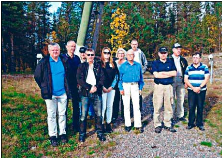
Seniorerna samlade för gruppbild

Efter teorigenomgången var det rundtur med vår buss och stopp för att gå ut och titta på olika raketramper och andra uppskjutningsanordningar. Besöket avslutades kl 1500, färden fortsatte sedan tillbaka mot Kiruna, med stopp i Jukkasjärvi.