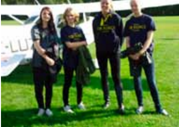
Deltagande elever efter landning i Älvsbyn

Kursen var förlagd till sista helgen i augusti där eleverna möttes av ett strålande flygväder. Kursen genomfördes i samverkan med Luleå-Boden flygklubb som ställde upp med