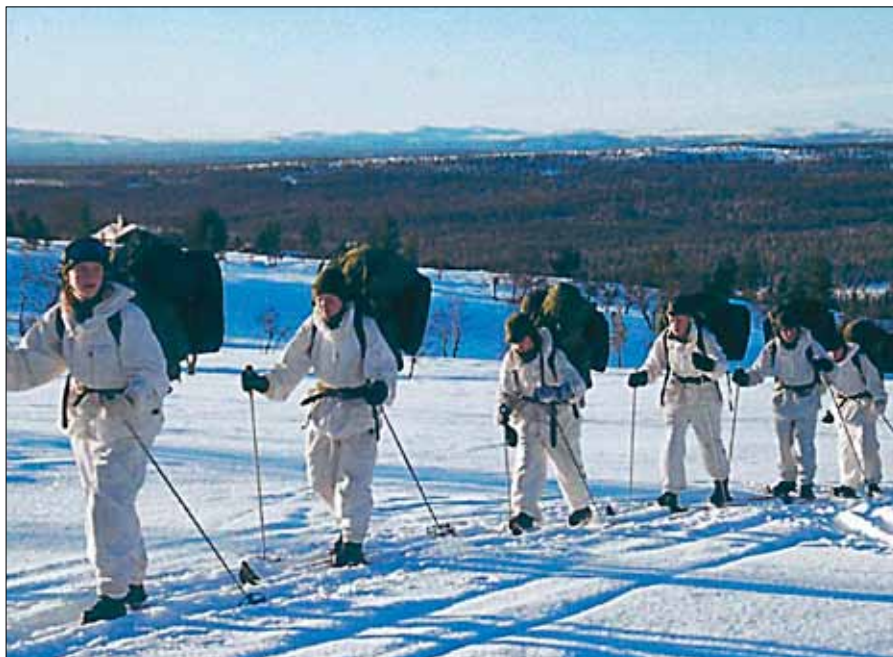
Skidmarsch i fjällmiljö på vinterkurs

Våra regioner kommer att ta ytterligare steg i att utveckla och etablera en bra Sommarskoleverksamhet . Viktigt för 2015 är främst att få till stånd bra rekryteringsmodeller som passar de olika regioner samt ”få upp volymerna” av deltagande ungdomar. Att sedan en väl fungerande samverkan med de ur Försvarsmakten som har att stödja Sommarkurserna – FV Frivilligavdelning och förbanden – är den absoluta grunden – om det råder ingen tvekan.