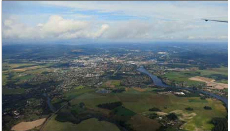
En helt fantastisk utsikt

Det är något speciellt med att lämna marken, höjd suddar ut olikheter och genom glashuven ser jag städer istället för människor och mönster av en vacker hemstad istället för detaljer, tänker jag för mig själv medan