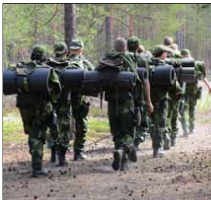
Viktigt med marschträning, ser lättare ut än vad det är.

det gott om. Efter en marsch ut till förläggningsplatsen för natten så var det dags att resa tält, bygga insynsskydd till latrinplatsen, göra i ordning hygienplats. När allt var i ordning så skulle samarbetet under total tystnad sättas på prov. Gruppövning med uppgift att söka efter olika föremål i terrängen gick riktigt bra och därefter väntade en natt i tältet.