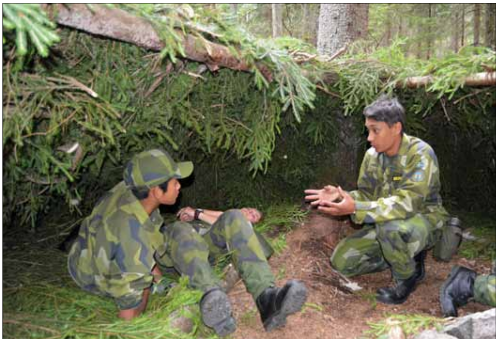
Spännande att sova i Skärmskydd

På grund av, eller kanske tack vare, en planeringsmiss på lördagen fick vi se fördelen med att ha officerare från flottiljen med i instruktörsledet. På fem minuter ordnades ett studiebesök hos veteranflygarna. När eleverna väl var på plats fick vi reda på att en 35:a och en 37:a skulle lyfta mot uppdrag i England. Snabbt och lätt beordrades språngmarsch mot platta 6 för att se starten från första parkett. Detta fick även Claes Er-