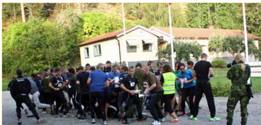
Här var det trångt, alla vill vidare snabbt

text: Sven-Olof Olofsson, FVR M