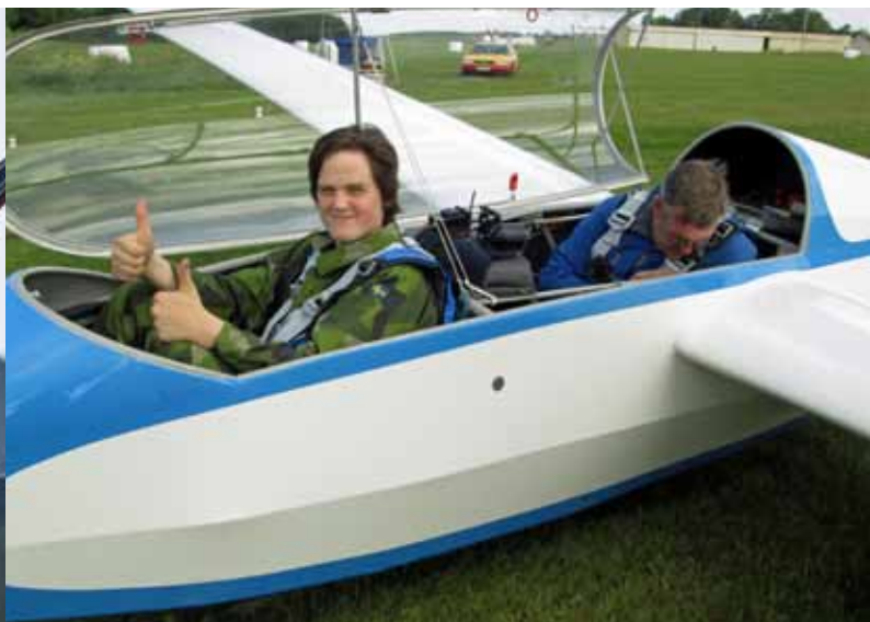
Även segelflyg provades på