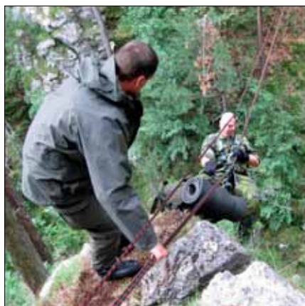
Här gäller det att hålla rätt på det mesta

På onsdagen började den riktiga alpmarschen, mulet, regn och riktigt leriga och branta stigar. Efter ett tag klarnade det upp och solen tittade