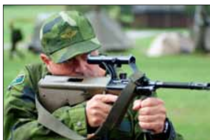
Vår Rookie med siktet inställt på ett bra resultat

På tisdagen började första etappen på alpmarschen, berget för i år var Kosiak (2024 h.ö.h). Vägen dit började med jaktstart från Gleinach till första check point tre kilometer bort. Händselös vandring mestadels genom bebyggelse. Andra check point ytterligare fem kilometer bort. Därifrån gick vi längs en vandringsled