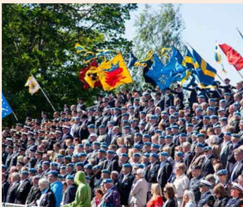
Magnifik inramning av bland andra Kongoveteranerna under Veterandagen.