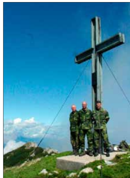
Vårt lag på Alpens topp

fram. Hård vandring men väl mödan värt när vi väl såg utsikten från toppen. Nedstigning med vätskekontroll ett nytt gasthaus och sedan ner samma leriga branta stig som vi gick upp. Det var riktigt jobbigt. Väl nere gavs skjuts tillbaka till Gleinach, dusch, torra kläder och sedan Edelweissceremoni på kvällen. Edelweiss utdelas efter avklarad alpmarsch. Torsdagen kom att gå i ett svep, först enskild patrullstig i urban miljö med mål att bekämpa längs vägen. Sim-