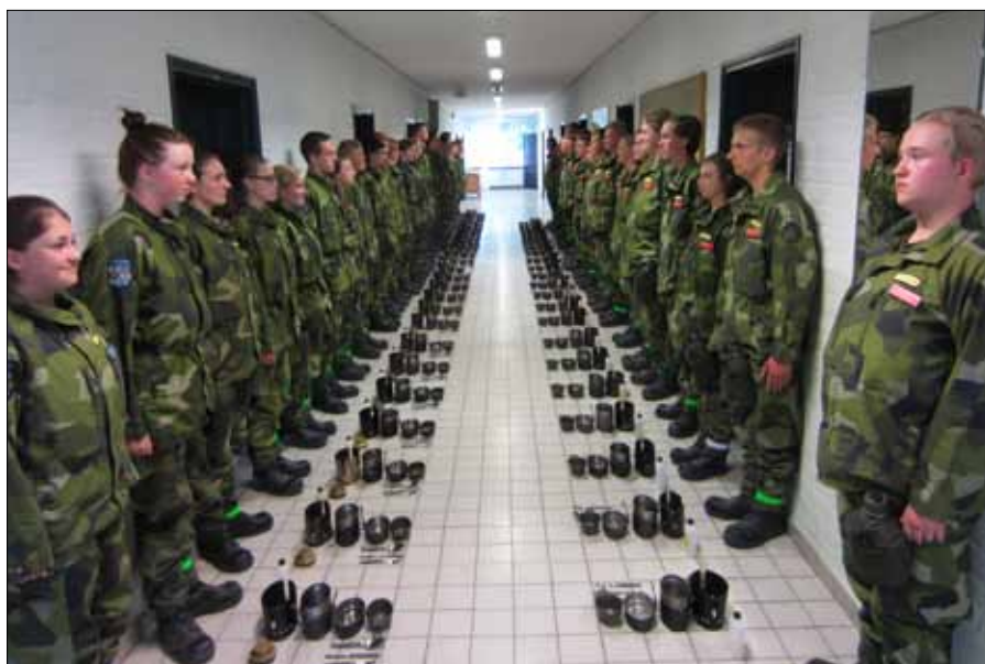
Perfekt rättning från kåsa till elev

Löpningen genomfördes på F 17 område på en slinga som var 5km. Där fick ungdomarna välja mellan 3, 5 eller 10km. Många utav ungdomarna hade aldrig sprungit mer än 3 km. Detta moment blev nog en stor tillfredsställelse hos många då de klarade av 5 eller 10 km.