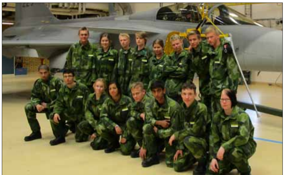
Gruppen samlad framför en JAS, här förevigas sommaren på F 21

Under kvällen påbörjades övningar i exercis, städrutiner gick igenom och slutligen var det dags för sängen. Efter att ha fått en god natts sömn så var då dags att få lära sig lägga tryckförband, hantera spritköket och få skjuta lite luftgevär. Hur en kniv, yxa eller såg ska hanteras visades och prövades av samtliga.