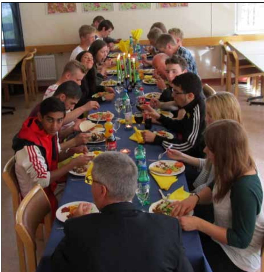
Avslutningsmiddag sista kvällen med god mat och många minnen

Efter rivningen av förläggningen på onsdagen blev det fotmarsch