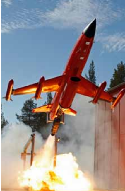
Nya målroboten i luften

in till provplatsen. Övriga kommande investeringar är bland annat ny målföljeradar, nytt flygledartorn, ny uppställningsplatta för strids och transportflygplan samt helikopter.