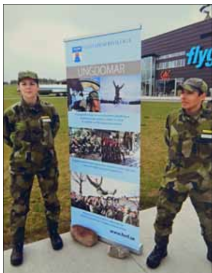
Två prydliga ungdomsrepresentanter

"Vi kvinnor som aldrig fick chansen överlevde ändå trots att vi inte lärde oss att bädda så att en femöring studsade på den släta filten och trots att vi inte fick ärtsoppa i snuskburk".