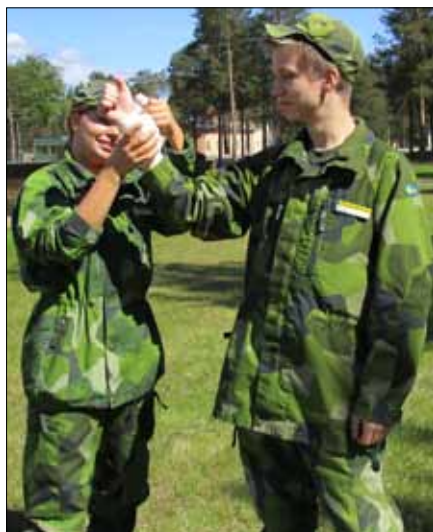
Kunna ta hand om skador, stora som små, övades filtigt på kursen

På tisdagen var det så äntligen dags att få komma ut i skogen och kramas med myggor, för dem var