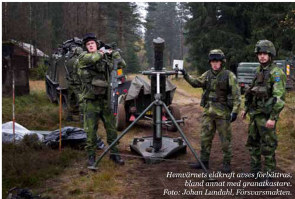
Hemvärnets eldkraft avses förbättras, bland annat med granatkastare.

till tolv månader grundutbildning. Principerna för de förmåner som gäller under dagens grundläggande militära utbildning ska gälla under hela grundutbildningstiden. Grundutbildningen är av största vikt för att skapa operativt användbara krigsförband. Vidare föreslår beredningen bl a att utbildningen av taktiska officerare utreds för att möjliggöra flera vägar in till officersbanan.