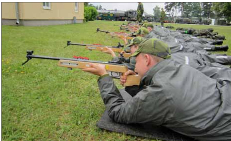
Förövning med kaliber .22 inför skarpskjutning på skjutbanan

Många har skaffat vänner för livet, Facebook har blivit berikad med en ny grupp. Mycket kan hända! Under utbildningen har det hänt och sagts en massa roligt som kommer att för-