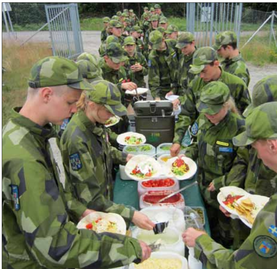
Maten sägs vara halva födan, här smakar det gott

När jag nu den 24 augusti 2014 sitter och tänker tillbaka på 2014 års sommarkurskompani känner jag en stor glädje över att ha träffat 51 stycken ungdomar som fått nya vänner, byggt på sitt självförtroende, vågat utmana sina gränser och bevisat för sig själva att inget är omöjligt.