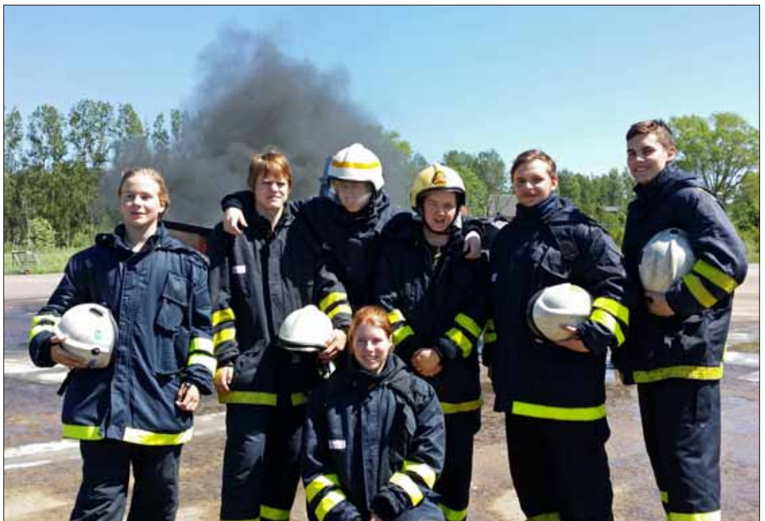
En del av eleverna på kursen