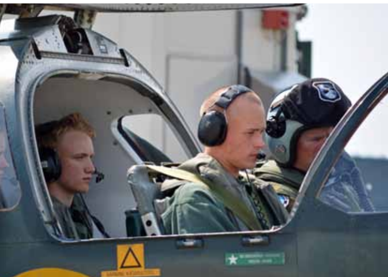
Uppskattad flygtur med SK 60

Kursen avslutades med en uppställning i parken utanför mässen, där