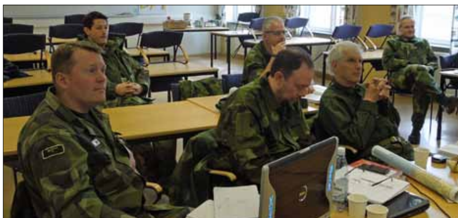
Djupt koncentrerade elever på väg mot övningsledarekompetens