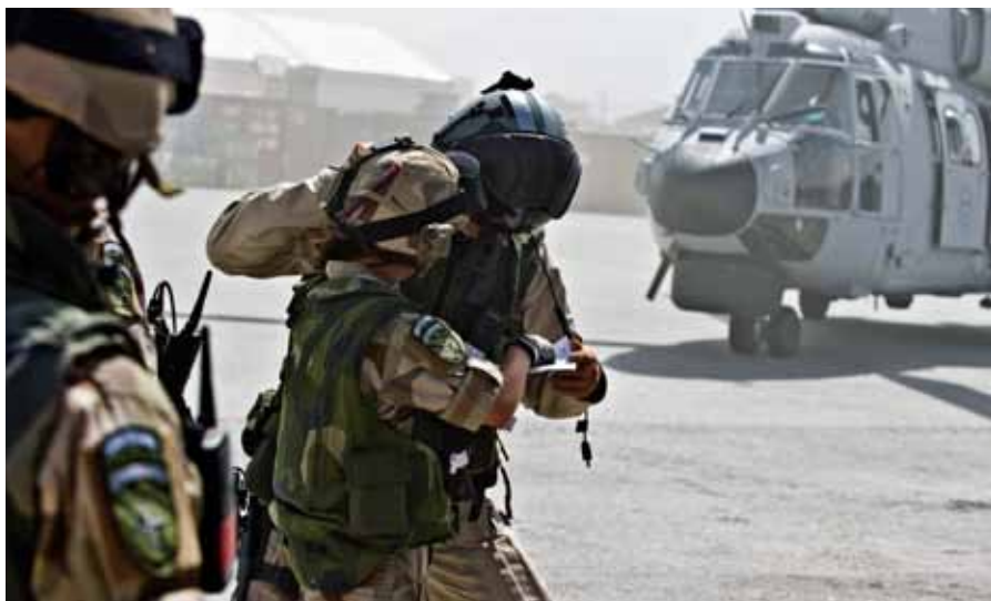
Samövning PRT MeS

Utöver hotbilden finns även en rad andra utmaningar. Under sommarperioden utgör värmen, damm och siktnedsättningar några av dessa. Dels i form av påverkan på personalen men också i form av snabba väderskiftet och krav på mycket noggrann planering av flyguppgiften där helikoptrarnas prestanda måste nyttjas till det yttersta med anledning av värmen. Damm påverkar också utrustningen och helikoptrarna, vilket leder till krav på utökad underhåll och anpassning. I samband med landning utgör det damm som virvlar upp många gånger att besättningarnas förmåga prövas till det yttersta i och med att det är mycket svårt att få ögonkontakt med referenser på marken. Träning för detta har skett inför insatsen, bland