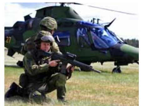
Soldater framför Helikopter 15 under en övning på Hagshult.