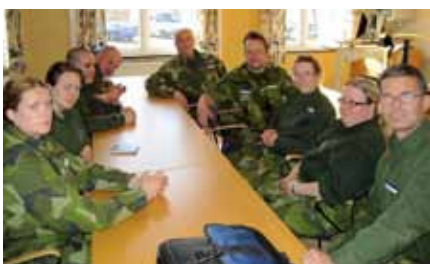
IK G Kursdeltagare

Efter vår föredragning för HKV PROD FRIV i december 2011 angående den nya grundläggande instruktörsutbildningen fick vi i uppgift att under år 2012 genomföra