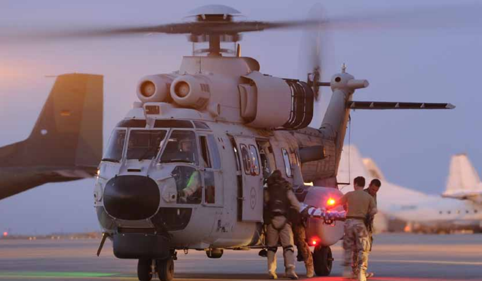
Urlastning av skadad soldat på Camp Marmal