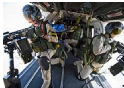
Dörrskyttar på jobbet