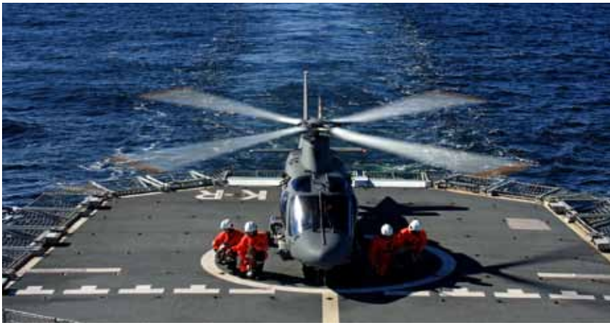
Sjöoperativ Helikopter 15 ombordbaserad på HMS Carlskrona, omgiven av flight deck team.