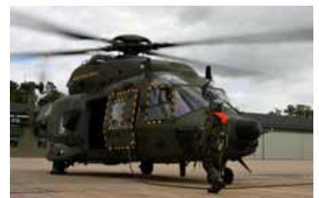
Helikopter 14 utanför Hangar i Ronneby.

Även om helikoptrar är en resurs för hela Försvarsmakten, är det viktigt