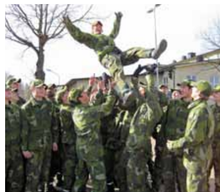
Hissas av kurskamraterna

hålla mig på den svenska toppen och anser nu att det är dags för mig att återgå till elitsatsningen.