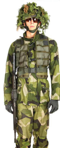
Enpunktsfäste i västfästet

Fäst ena karbinhaken på vapenremmen i det främre fästet och den andra i mellanfästet eller i kolvfästet på vapnet.