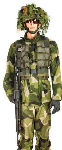
Rem i västfästet