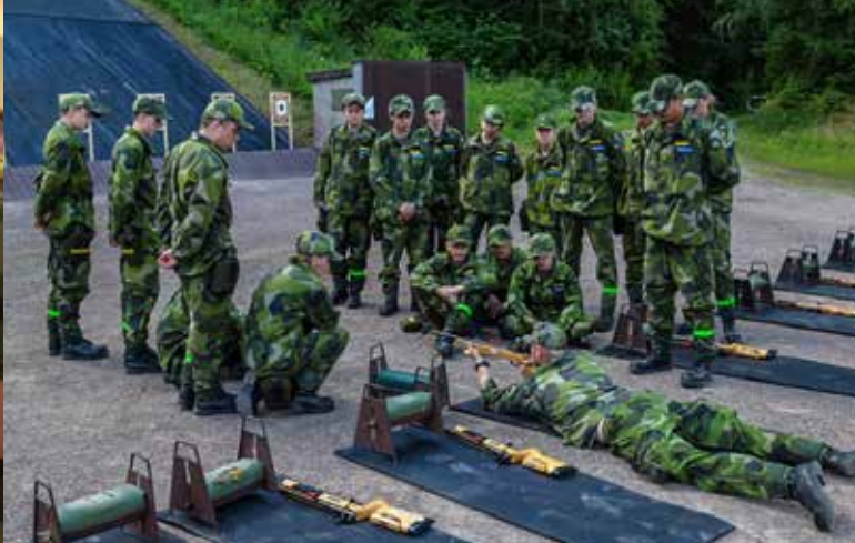
ett viktigt moment i kurserna. Fottejp när instruktörerna får välja.