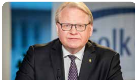
Försvarsminister Peter Hultqvist vid Folk och Försvars Rikskonferens 2021.