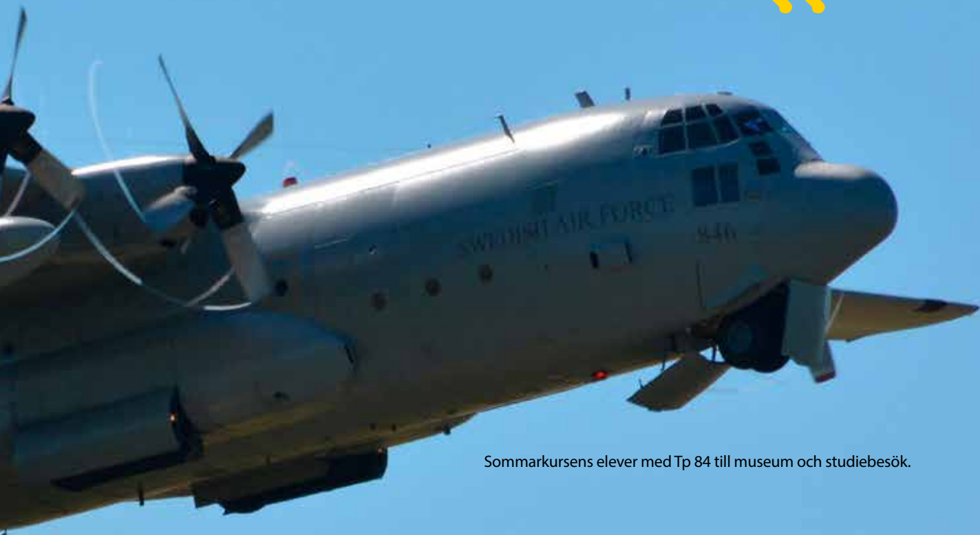
Sommarkursens elever med Tp 84 till museum och studiebesök.

Flottiljchefen och chefen för Basenheten är självklart väldigt nöjda att de frivilliga är ”tillbaka” på flottiljen igen. Basenhetens ledning, vill också gärna träffa både kansliet och styrelsen för FVRF Väst, så fort vi får resa och träffas igen. Det är tråkigt att Corona sätter begränsningar i frivilligverksamheten, men vi får se det som att det skapar mer tid att planera för ännu mer verksamhet, när väl restriktionerna hävs. – Håll i, håll ut och ta hand om er, tills vi ses! hälsar övlt Järvare.