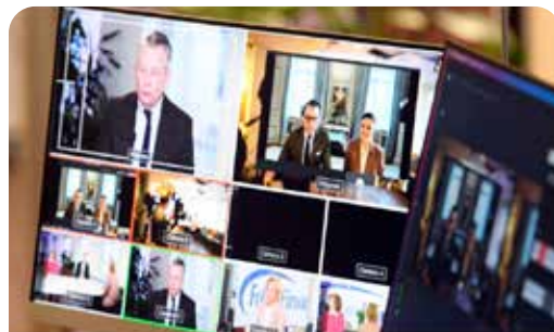
Rikskonferensen 2021 arrangeras inte på plats i Sälen i år utan istället som en digital Tv-produktion.

Bilder och text är hämtat från Folk och Försvars hemsida. Där kan du läsa mer samt se alla bilder. https://folkochforsvar.se/themepage/rikskonferensen/ (Red. FVRF anm.)