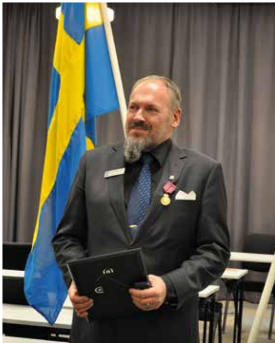
Flygvapenfrivilligas Kungl. Guldmedalj.