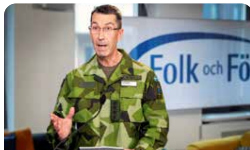
Överbefälhavare Micael Bydén på Folk och Försvars Rikskonferens 2021.