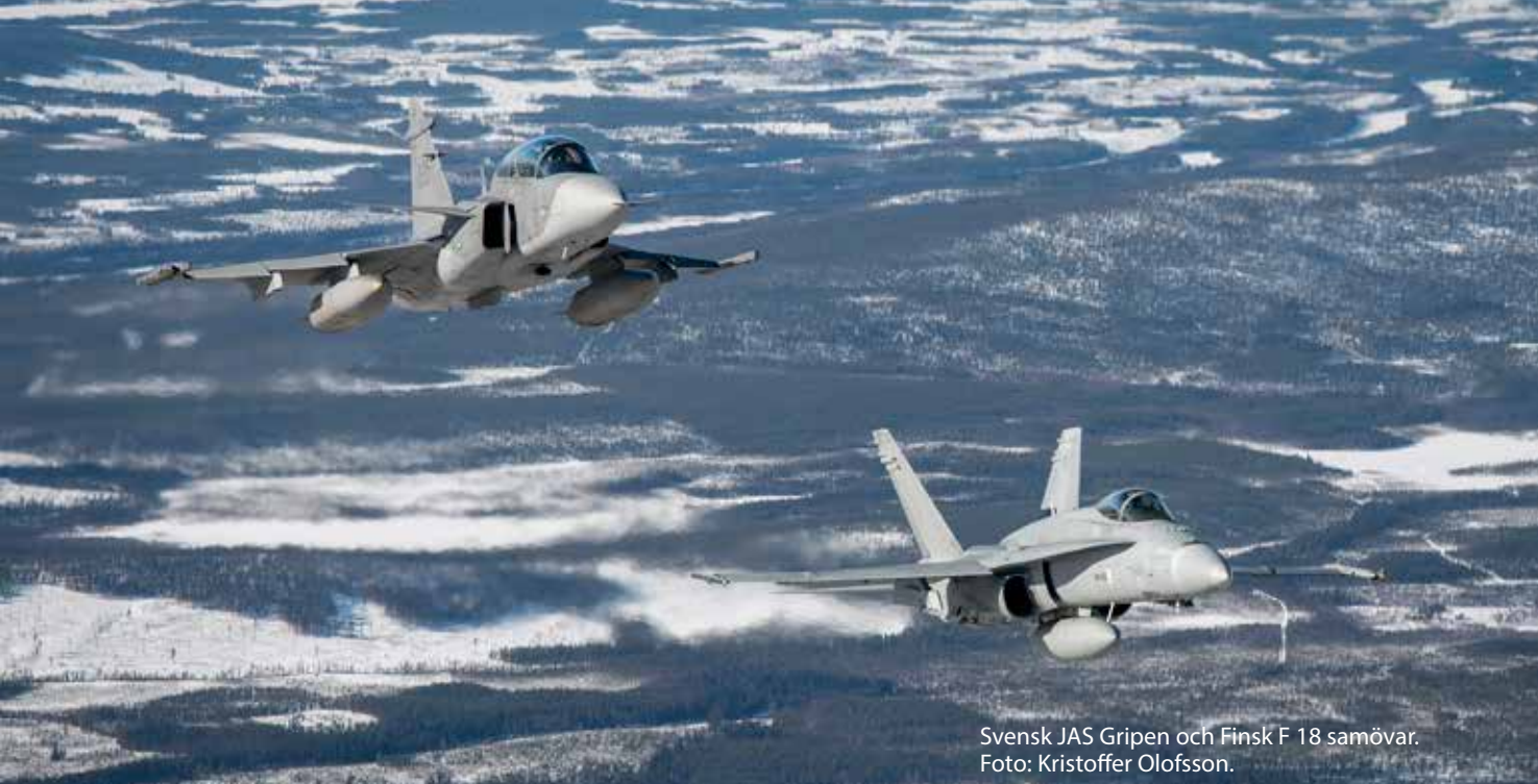
Svensk JAS Gripen och Finsk F 18 samövar.

i syfte att skapa förutsättningar för en god verksamhetssäkerhet och flygsäkerhet. Riskmedvetenhet och förståelse för riskhantering är mycket viktigt i dessa sammanhang. Detta är vårt gemensamma ansvar.