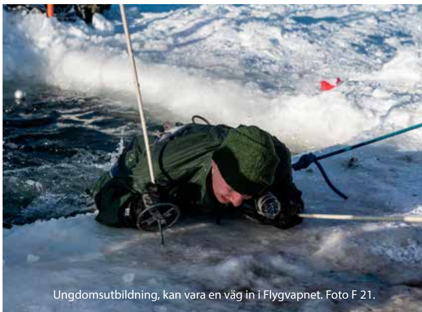
Ungdomsutbildning, kan vara en väg in i Flygvapnet.

I ett historiskt perspektiv har frivilligorganisationer spelat en viktig roll för Flygvapnets krigsförband genom sin mångfald av människor med olika utbildnings- och yrkeserfarenheter, men också som inkörsport till en karriär i Flygvapnet. Betydelsen av ungdomsverksamheten understryks av det stora antal aktivt tjänstgörande inom Flygvapnet och Flygstaben som har