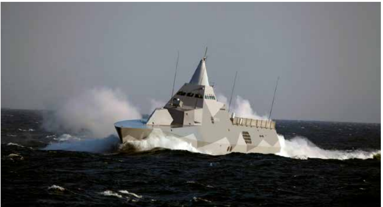
HMS Karlstad en av Visbykorvetterna.

Detta är förmågor som en angripare måste förhålla sig till. Beslutet att anskaffa Patriotsystemet, där den första eldenheten bedöms leverera initial operativ förmåga redan i slutet av detta år, var därför strategiskt viktigt.