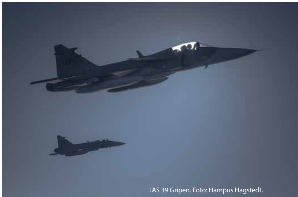
JAS 39 Gripen.

GENERALMAJOR CARL-JOHAN EDSTRÖM CHEF FÖR FLYGVAPNET